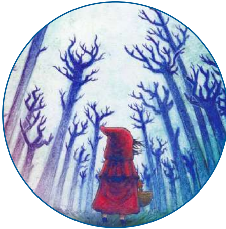
La Petit Chaperon Rouge Cie Théâtre du Chêne Noir

FEVRIER & MARS JEUNE PUBLIC & TOUT PUBLIC