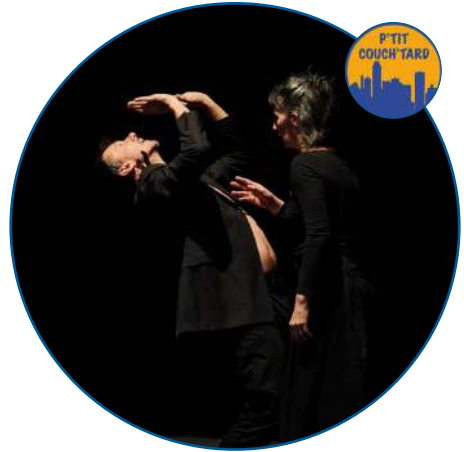
Toutes mes lunes Cie Mutine

Le Petit Chaperon rouge : une héroïne des temps modernes ! Entre une Mère dont les contraintes du quotidien ont fini par étouffer les rêves, et une Mère-Grand féministe engagée à la verve détonante et un brin déjantée, elle se révèle farceuse, courageuse et rusée, déterminée à aller jusqu'au bout de ses rêves : danser, danser, danser... Dans cette version résolument contemporaine du conte universel qui promet bien des surprises, échappera-t-elle au redoutable Loup ? Entre humour, folie et moment de tension, cette nouvelle version du conte promet quelques surprises et s'adressera à tous les enfants et à tous les grands enfants.