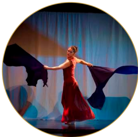
De l'air Cie Entresols