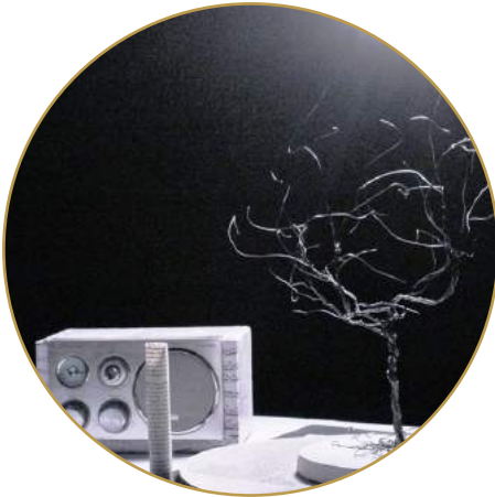
A nous deux Cyrano Cie Claque La Baraque