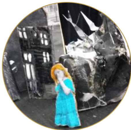
La petite fille et le corbeau Cie Mouka

Entre blizzards et brises légères, « De l'air » est une ballade aérienne qui se nourrit des sensations éprouvées par le corps au contact de l'air, du souffle, du vent. C'est un voyage poétique où l'imperceptible prend corps, l'invisible devient visible. Dévoilé par des tracés aux infinies nuances, l'espace respire, les limites s'effacent. Deux danseuses, les corps traversés par d'invisibles courants d'air, balayés par des souffles imaginaires, évoluent sur le plateau.